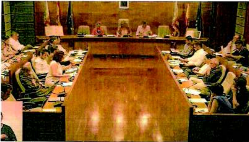
Imagen de la sesión del pleno de Torrent.