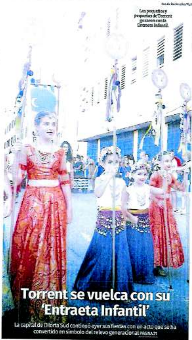
Los pequeños y pequeños de Torrent gozaron con la Entraeta Infantil .