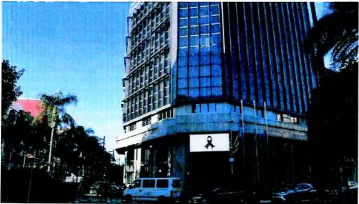
Edificio consistorial de Torrent