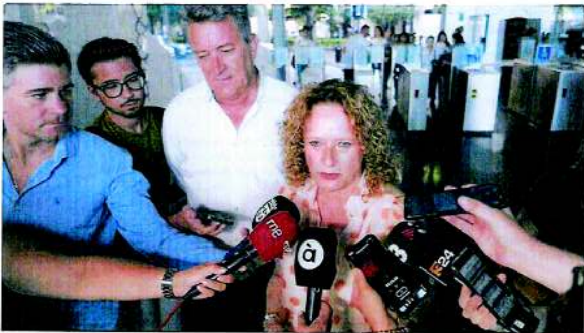
La alcaldesa de Torrent, Amparó Folgado, en una atención a medios.

PSPV y Compromís impulsan una comisión para investigar si el contrato del gabinete de comunicación municipal se adjudicó de forma irregular y si se ha utilizado con fines políticos