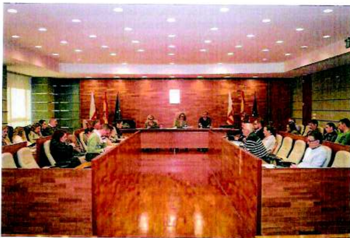
Pleno de Torrent - AYUNTAMIENTO DE TORRENT