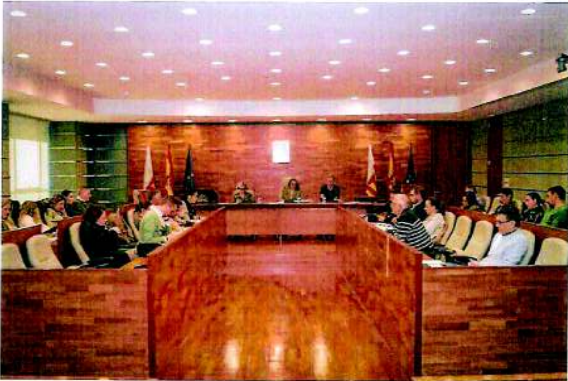
Pleno de Torrent