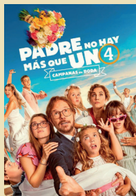
PADRE NO HAY MÁS QUE UNO 4