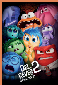
DEL REVÉS 2