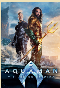
AQUAMAN Y EL REINO PERDIDO