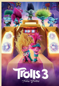
TROLLS 3 TODOS JUNTOS