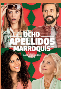
8 APELLIDOS MARROQUIS