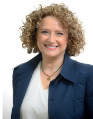
Amparo Folgado Tonda Alcaldessa de Torrent

Amb alegria i amb molta il·lusió, comencem unes de les festes més esperades de l'any, el Nadal. Des de l'Ajuntament de Torrent hem preparat tot un programa d'activitats per a viure la màgia del Nadal a la nostra ciutat, amb propostes per a tota la família, des dels més xiquets de la casa als més majors.