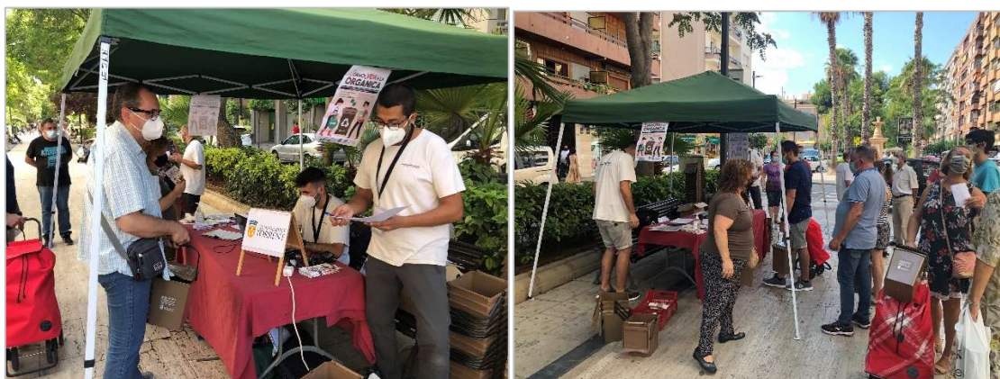
Imatge 1. Punt d'informació al carrer (carpa).