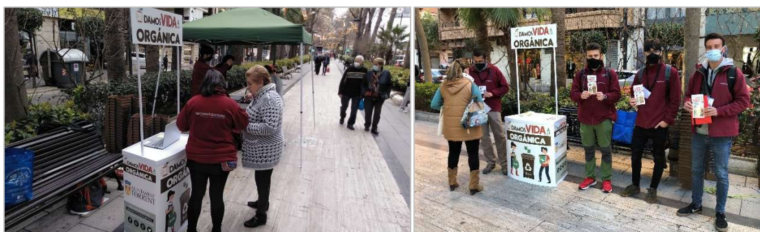
Imatge 2. Punt d'informació al carrer (dreta) i equip d'educadors ambientals per a l'atenció a la ciutadania (dreta).

A més, es va dissenyar material de comunicació associat a la campanya i es van fer publicacions setmanals en xarxes (Facebook, Instagram, Twitter) i mitjans de comunicació tradicionals.