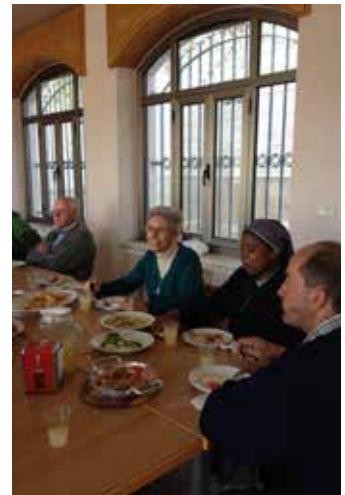
Conferencia internacional austronesia. Taiwán, noviembre de 2012.