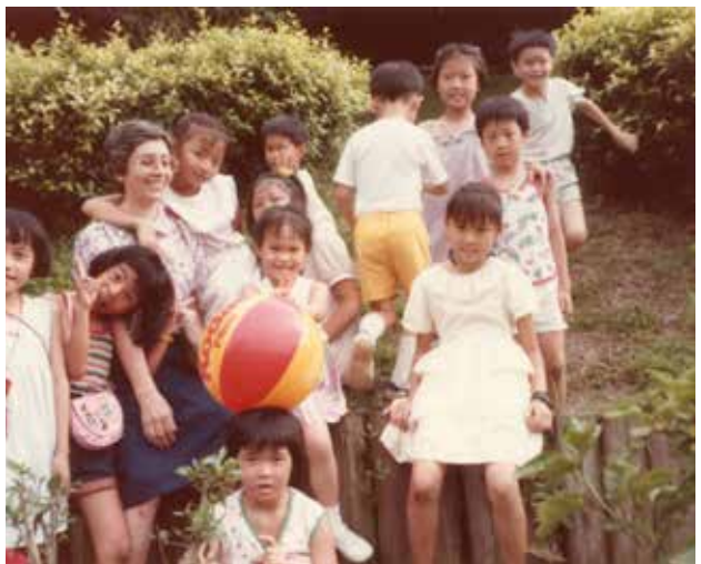
Catequesis parroquial. Taipei, 1983.