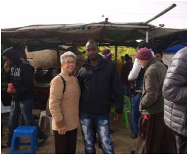
Visita al campo de detención de Holo, Israel, 2016.