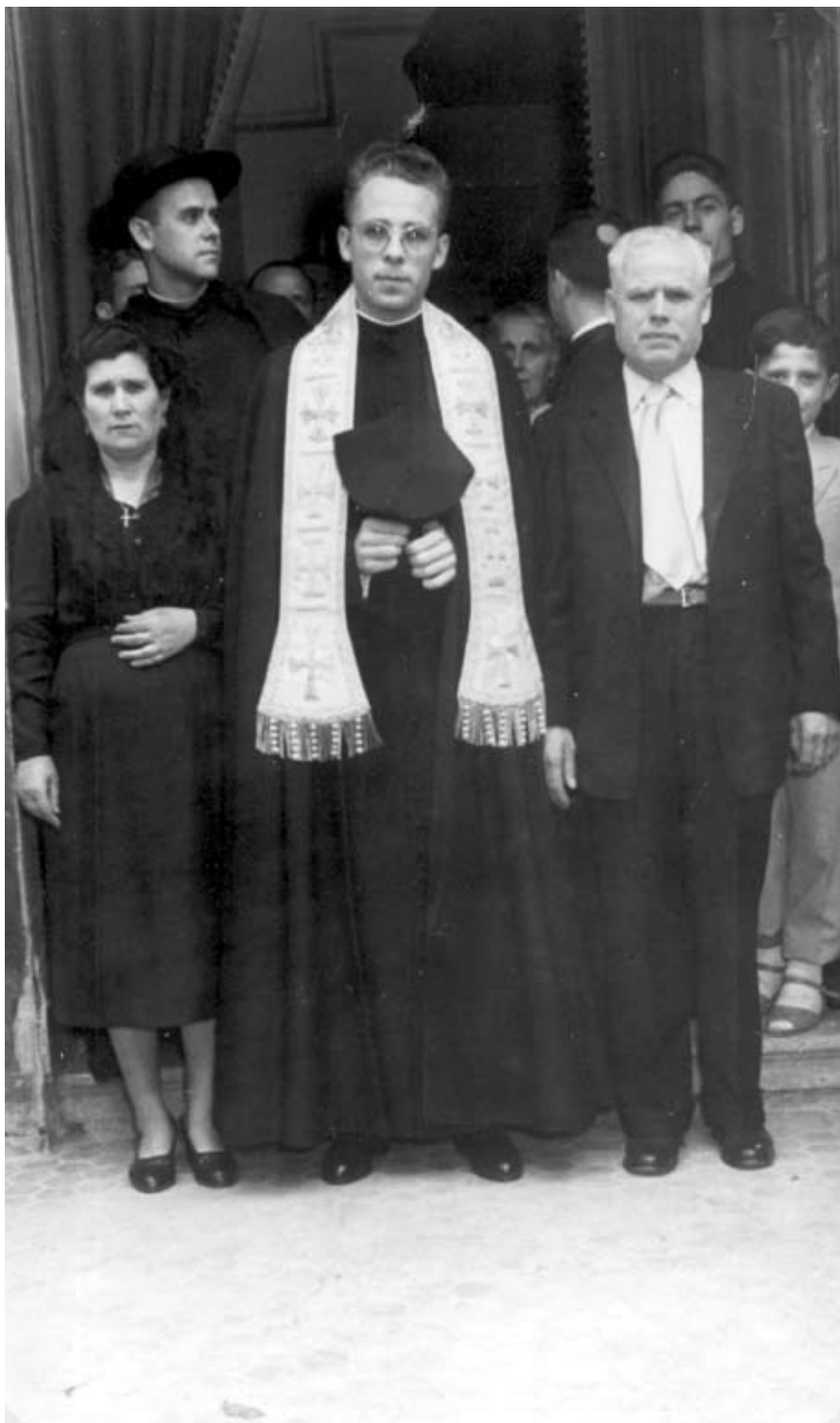
Tras su primera Misa con su padre y su tía. 6 de julio de 1955.