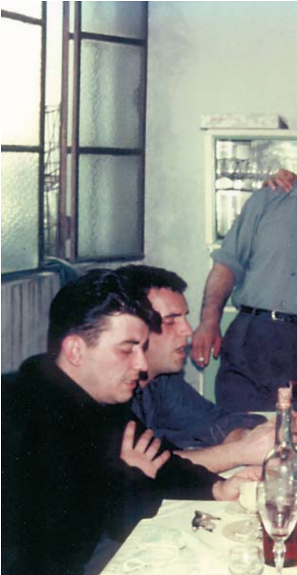
En primer término con sacerdotes valencianos en Argentina, 1969.