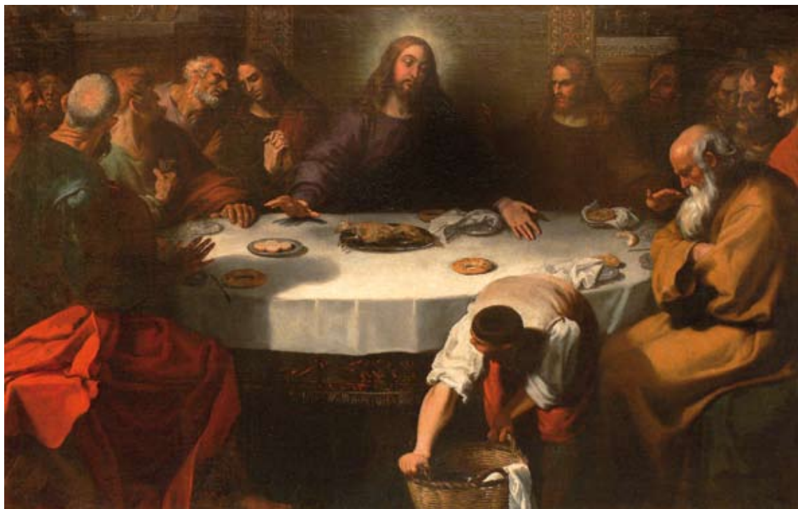
La última cena , cuadro atribuido a Gregorio Bausa, discípulo de Juan Ribalta, perteneciente a la predela del antiguo retablo de la capilla de la Virgen del Rosario de la iglesia de la Asunción de Nuestra Señora de Torrent.