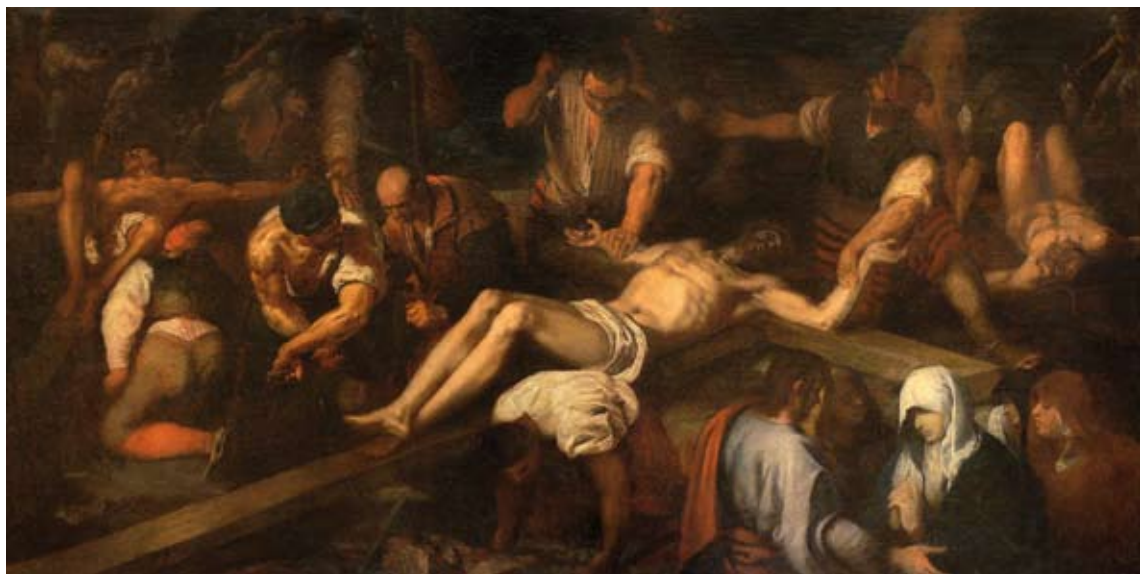
La Adoración de los pastores y Preparativos para la Crucifixión , cuadros atribuidos a Juan Ribalta, pertenecientes a la predela del antiguo retablo de la capilla de la Virgen del Rosario de la iglesia de Nuestra Señora de la Asunción de Torrent.