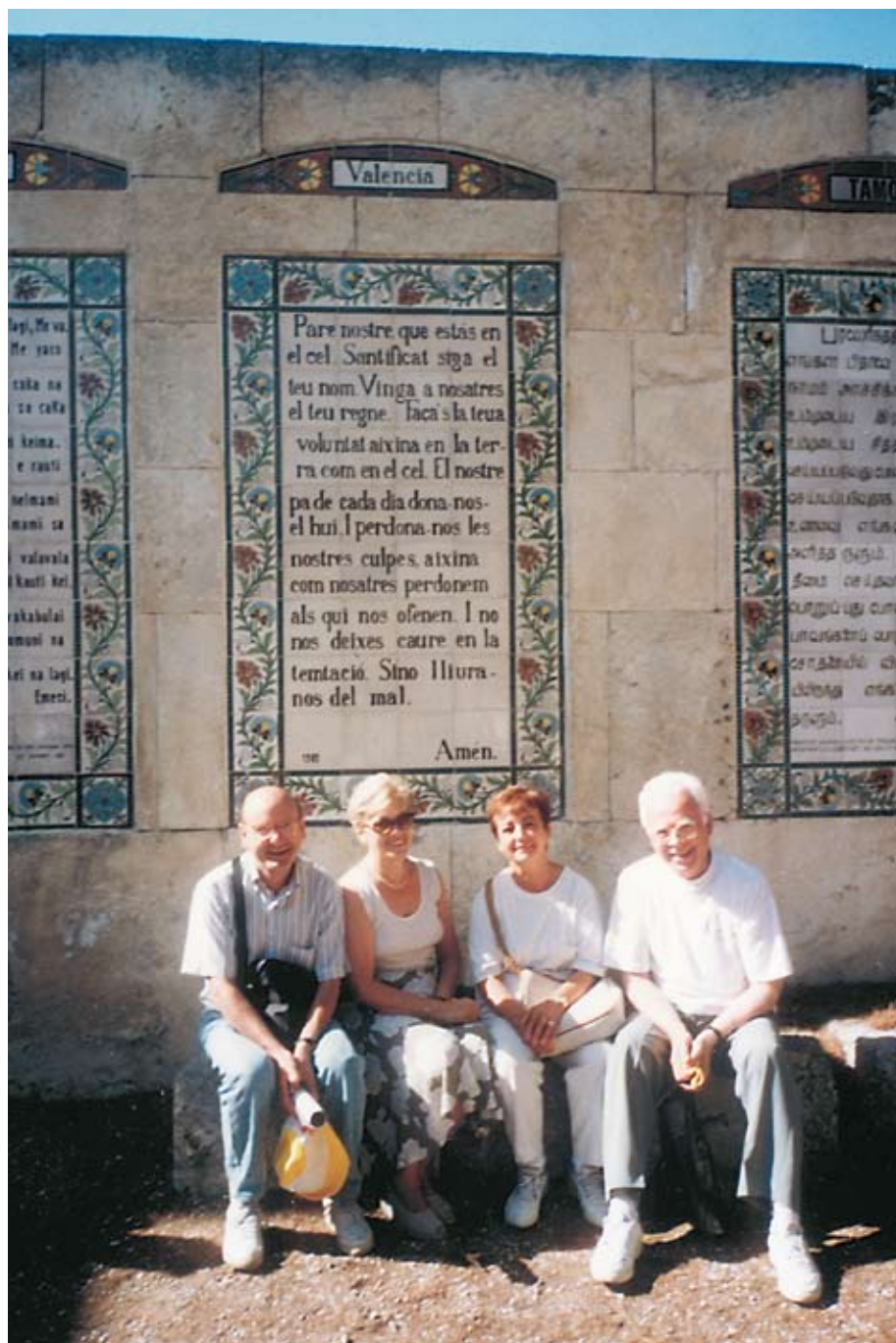
Peregrinación a Tierra Santa en 1996, junto con otros miembros de la parroquia.