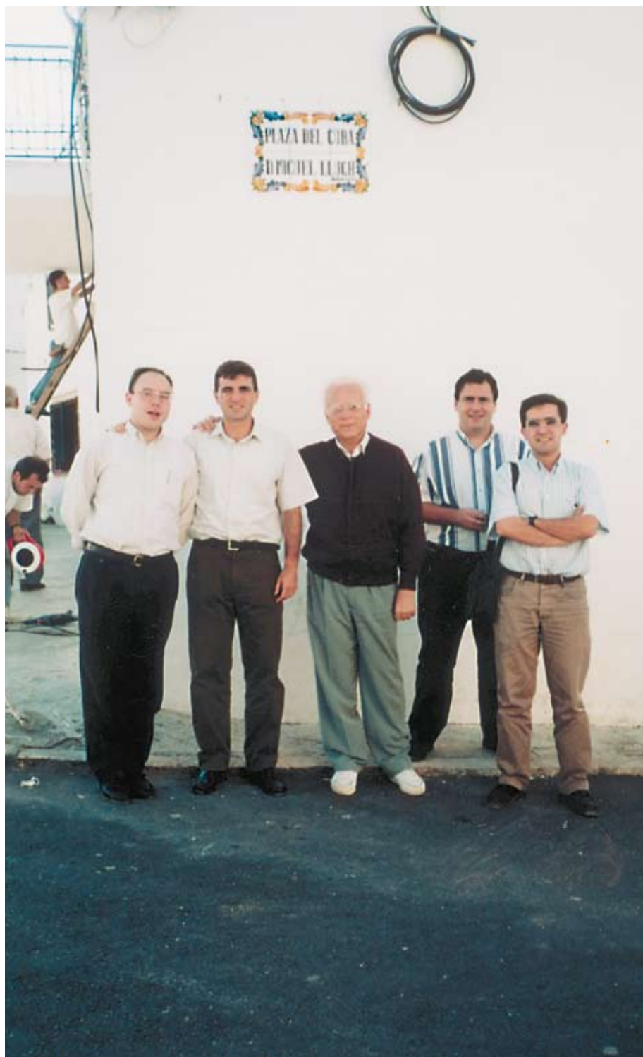
Con jóvenes seminaristas en Navalón, 1996.