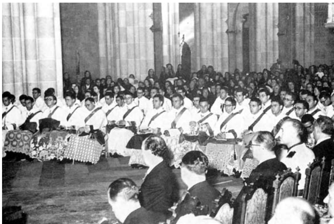
En la catedral de Valencia el día de su ordenación el 26 de junio de 1955.