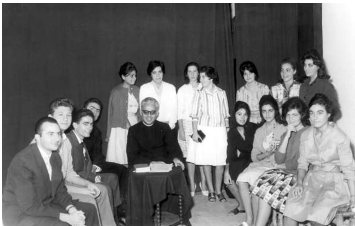
Inauguración y bendición de San Fernando Rey. 12 de marzo de 1961 (arriba). Primeras reuniones con catequistas de S. Fernando (abajo).