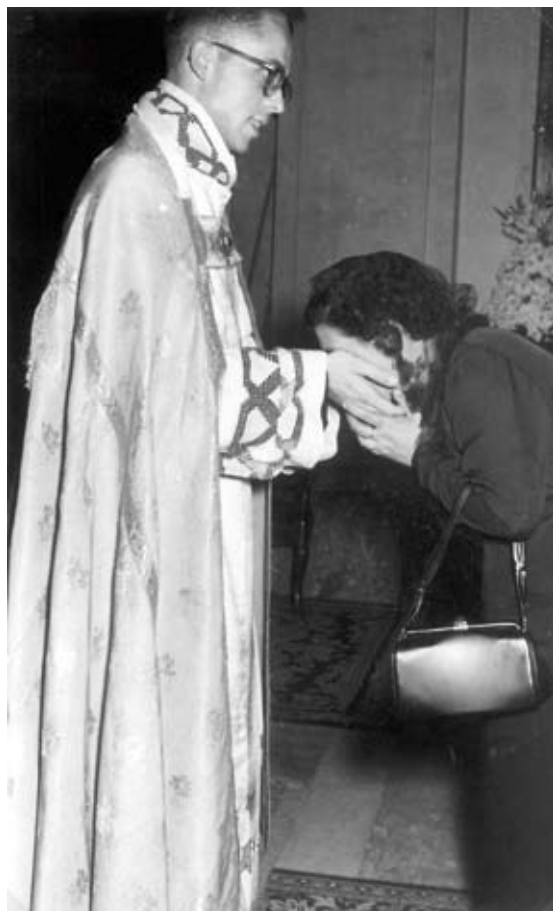
Primera Misa. 6 de julio de 1955 (izquierda).

Besamanos, rito que se realiza al finalizar la primera Misa de un sacerdote y que recuerda que éste puede consagrar el Pan y el Vino en la Eucaristía (derecha).