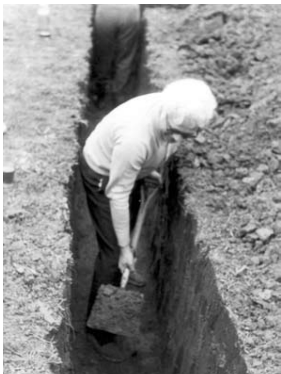
Parroquia de Cristo Obrero en Buenos Aires (arriba).

Cavando una zanja para los cimientos de la parroquia Cristo Obrero en Buenos Aires (abajo).