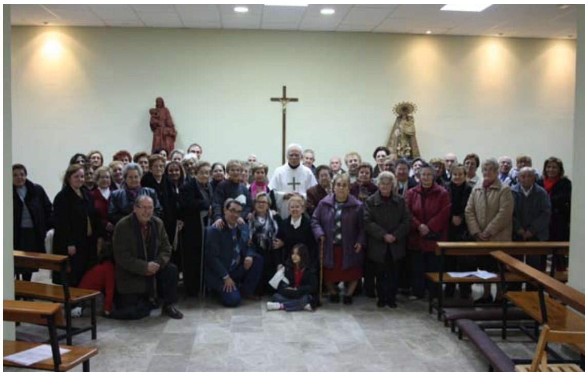
Comulgar de impedidos, 2010 (arriba). Junto a feligreses en el Centro Madre de los Desamparados (abajo).