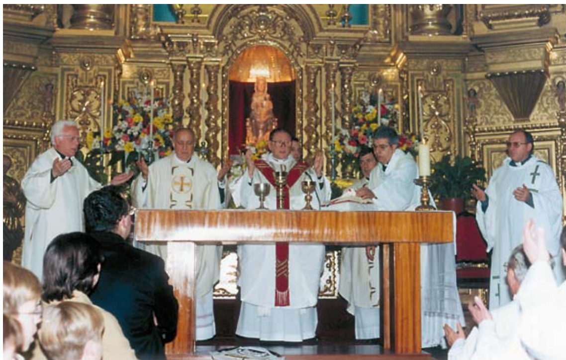
Equipo sacerdotal con el arzobispo en el 750 Aniversario de la presencia de la Iglesia en Torrent (páginas anteriores). Con el nuncio, el arzobispo, sacerdotes y seminaristas, 1999 (arriba). Día de la Familia en 1999. Eucaristía presidida por el nuncio del Papa, monseñor Lajos Kada (abajo).