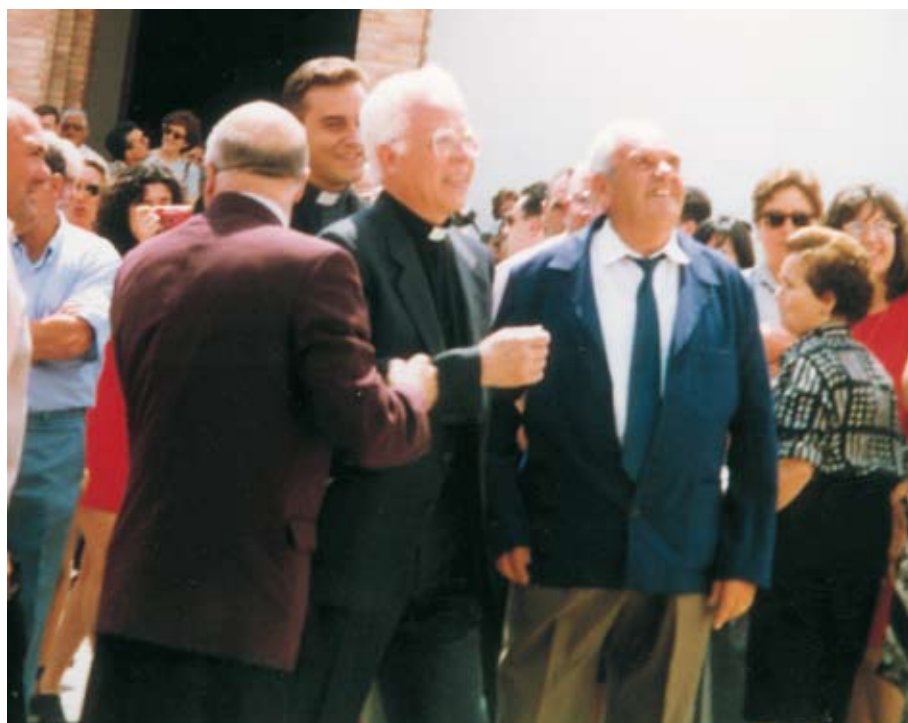
Entronización de una imagen de la Virgen de los Desamparados en Buenos Aires (arriba). Le dedicaron la Plaza Miguel Lluch en Navalón, 1996 (abajo).